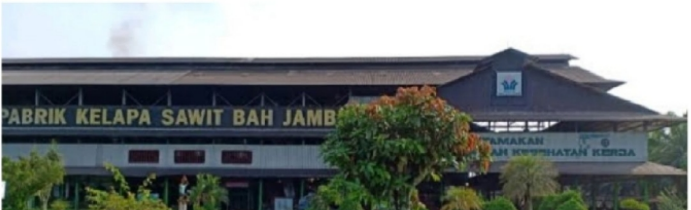
PTPN IV PKS Bah Jambi, Kecamatan Jawa Maraja Bah Jambi, Kabupaten Simalungun

SIMALUNGUN- Aliran limbah cair hasil produksi PTPN IV PKS Bah Jambi yang mencemari Sungai Bah Bolon, hingga kini masih menjadi gunjingan kalangan masyarakat pasca beredarnya rekaman video berdurasi 9 detik terjadi pada hari Minggu (15/05/2022) yang lalu.